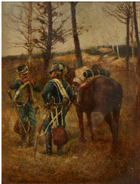
Lots 37 et 38